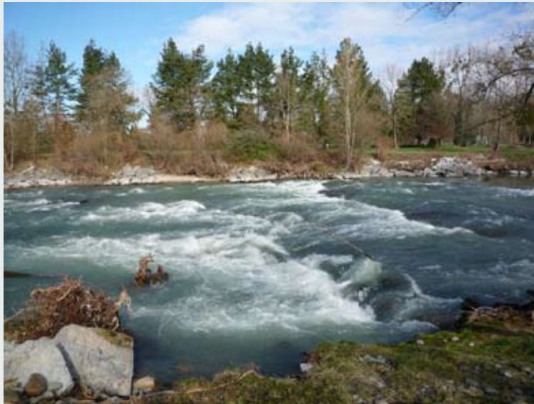
Le Gave rugissant (février 2014).

Ces pantouns, si variés, si riches, essentiellement faits pour être dits, auxquels nous mêlons – ou essayons de mêler, nous autres débutants – nos voix un peu hésitantes, c'est vers eux que je fonce en premier, en ouvrant «ma revue».