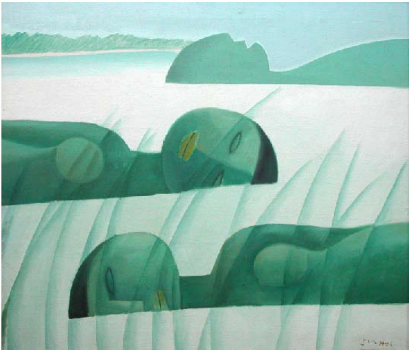
Three Dreamers Huile sur toile, 100x80 cm, 2009 © Khoo Sui Hoe