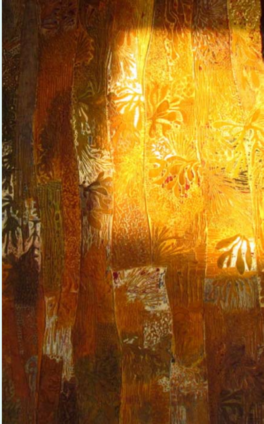
Sédiments graphiques Encre sur plâtre, 2013 © Lucie Nouhaud