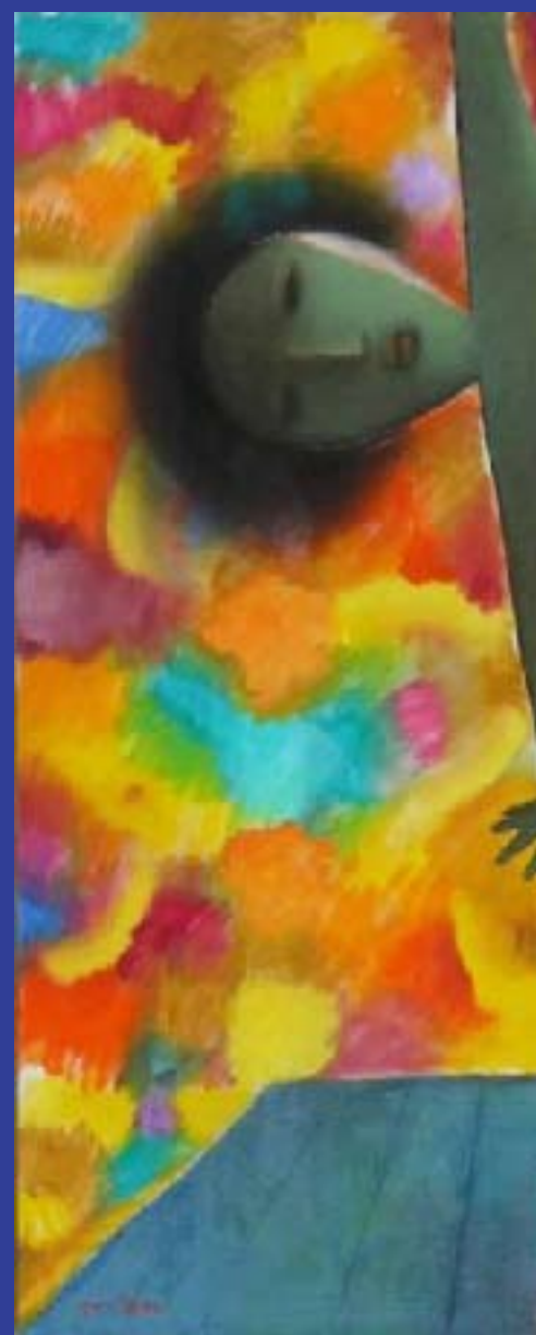
The Colo Huile sur toile, 12 © Khoo