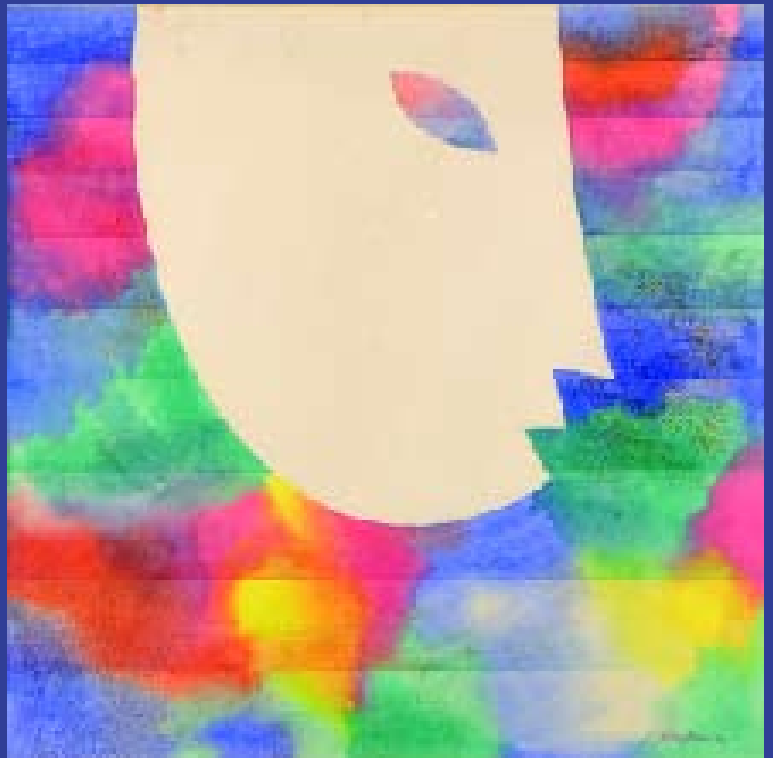
Image Colourful I Aquarelle sur toile, 52x52 cm, 1990 © Khoo Sui Hoe