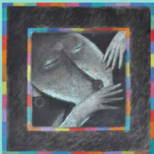
En couverture : Dancer I Huile sur toile, 90x90 cm, 1993 © Khoo Sui Hoe