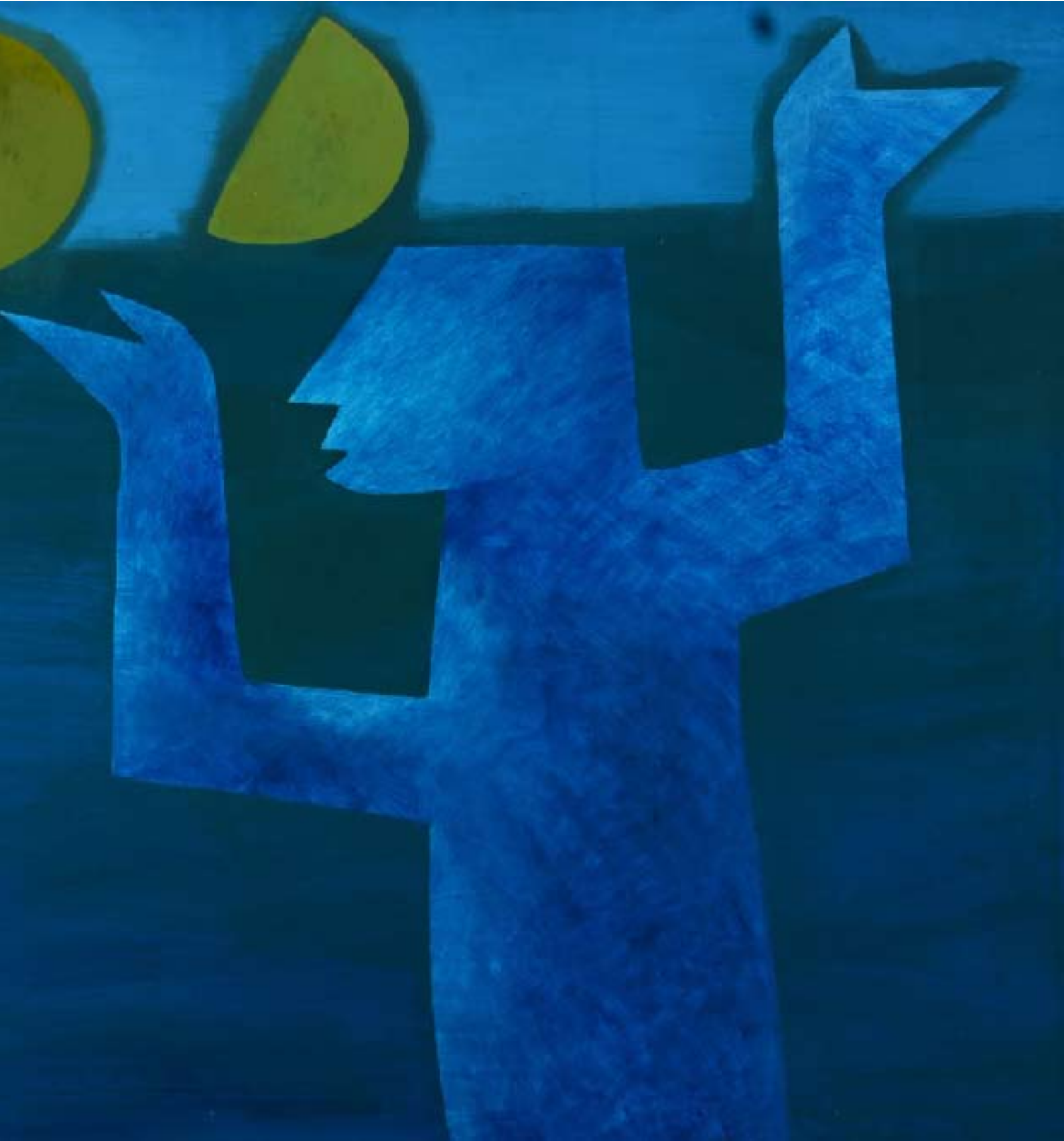
Man and Moon I Huile sur toile, 90x120 cm, 1985 © Khoo Sui Hoe