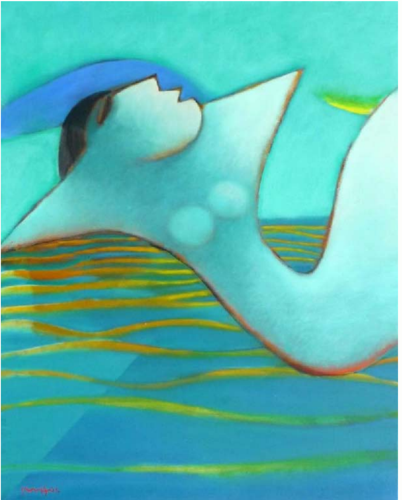
Rebirth III Huile sur toile, 100x80 cm, 2009 © Khoo Sui Hoe