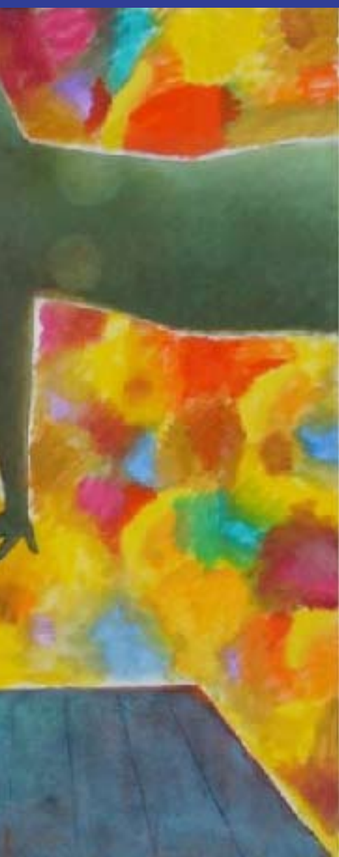
Colorful Sky 100,5x100 cm, 2008 Shui Hoi

Maison haute sur la plage où quelqu'un joue du violon. Corps gracile comme une image qui me fait perdre la raison.