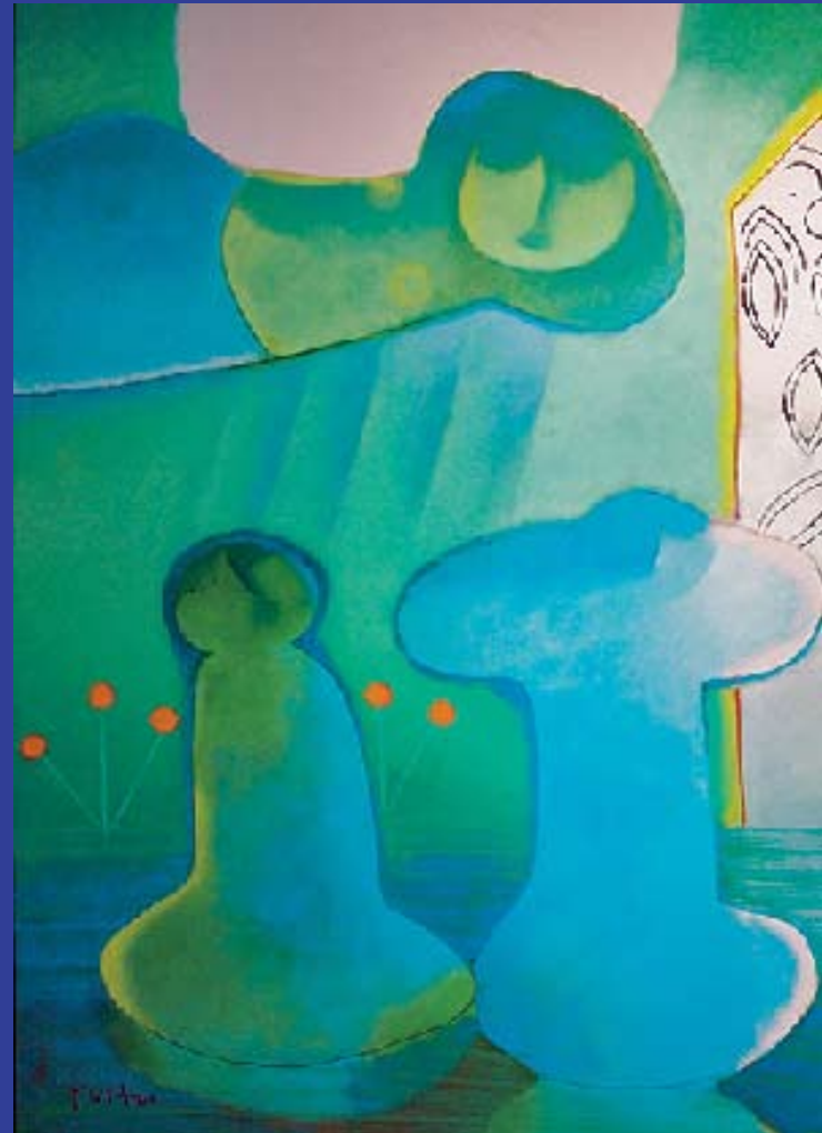
River C Huile sur toile, 1 © Khoosha

Batiks d'hier, batiks d'aujourd'hui la cire chaude imprime son destin ; L'étoile filante traverse la nuit notre vie suspendue à son chemin.