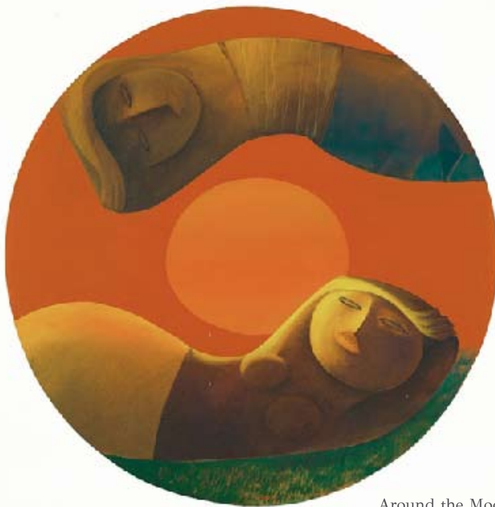
Around the Moon

Huile sur tissu, 88x88 cm, 2012 © Khoo Sui Hoe