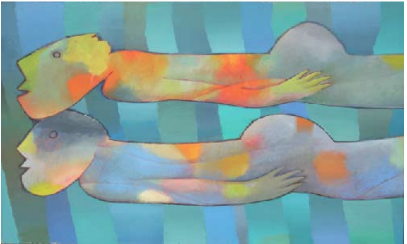
Two Divers II Huile sur toile, 115x64 cm, 1978 © Khoo Sui Hoe