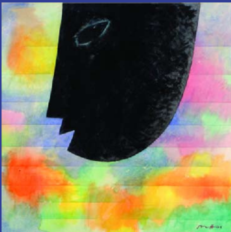
Image Colourful II Aquarelle sur toile, 52x52 cm, 1990 © Khoo Sui Hoe