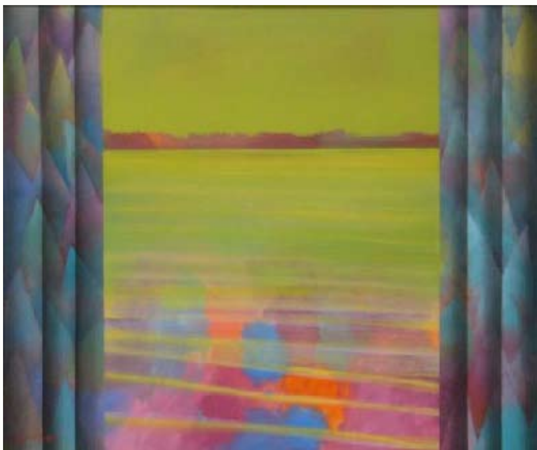
Lake Bawa Huile sur toile, 90x120,5 cm, 2002 © Khoo Sui Hoe