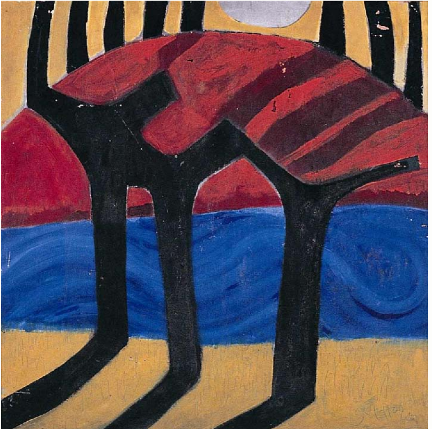
Trees by the Sunset Huile sur toile, 76x76 cm, 1967 © Khoo Sui Hoe