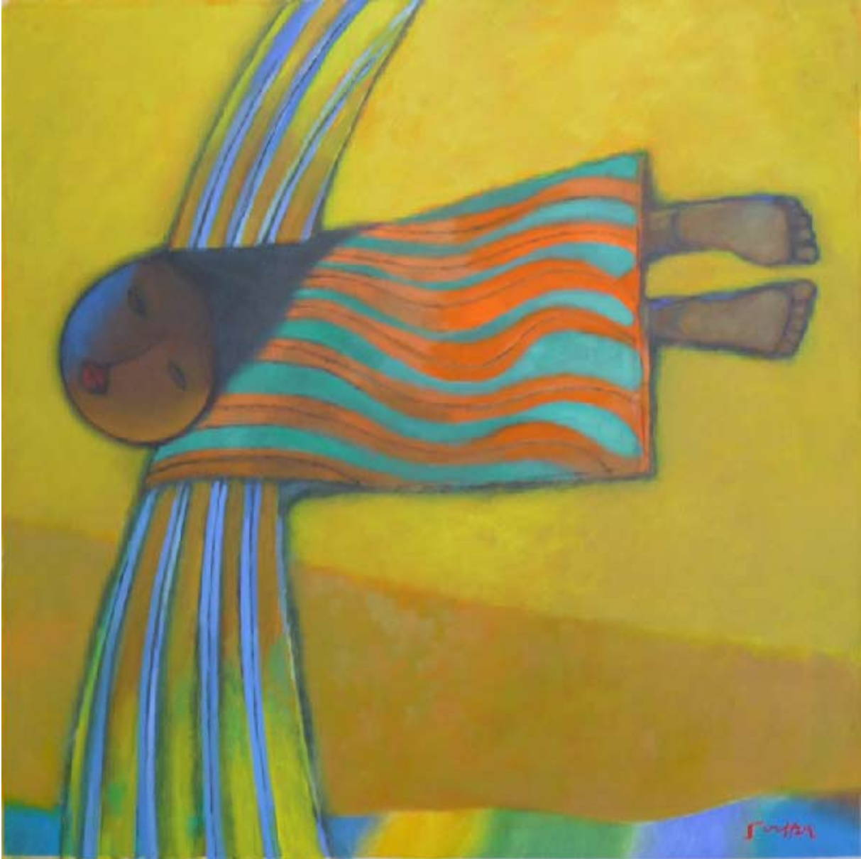
Fly Over Huile sur toile, 96,5x96,5 cm, 2010 © Khoo Sui Hoe