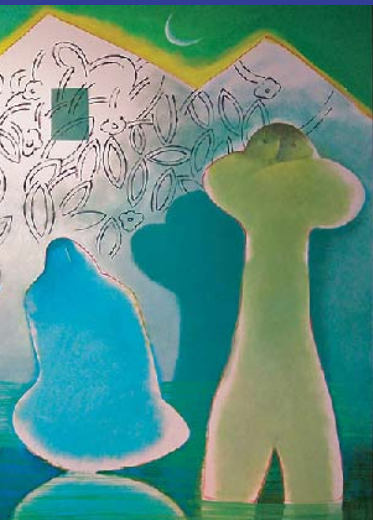
Crossing 83x244 cm, 2010 Sui Hoe

Après la figue et le raisin voici venir les feuilles mortes. De quoi donc sera fait demain ? Le vent d'automne est à ma porte.